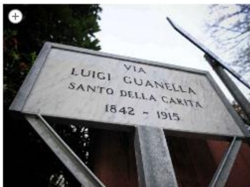
Como nuova targa via Luigi Guanella santo della carità

COMO "San Guanella tra noi": è questo il titolo della grande festa del ritorno dell'urna di Luigi Guanella nella sua Como, dopo il lungo pellegrinaggio iniziato a gennaio nelle Case guanelliane del Nord Italia e nelle parrocchie della Diocesi di Como.