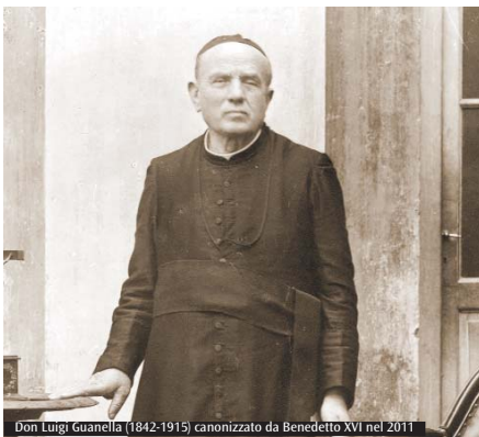
Don Luigi Guanella (1842-1915) canonizzato da Benedetto XVI nel 2011