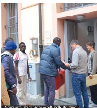
Alcuni profughi vengono accolti nelle strutture

entusiasmante sia per gli insegnanti, che molto si sono impegnati ad accompagnare gli alunni nel percorso, sia per noi che ci siamo appassionati a stare con le classi». Le incertezze dei primi momenti si sono mutare in una chiara apertura al Progetto, tanto che c'è già una richiesta di una dozzina di scuole per continuare ed estendere l'esperienza. Una terza possibilità di incontro con le religioni del Forum, sarà martedì 27 ottobre alle 17 in Expo, al Conference center, per una conversazione sul tema «Le religioni, cibo dello spirito». Le religioni alimentano e permeano la relazione dell'uomo con Dio, con il creato e con il proprio lavoro, con gli altri esseri umani e con il proprio corpo. Ciascuna tradizione religiosa intende presentare un aspetto di questa relazione uomo-Dio non solo con la parola, ma anche con la musica, il canto, la danza e immagini.